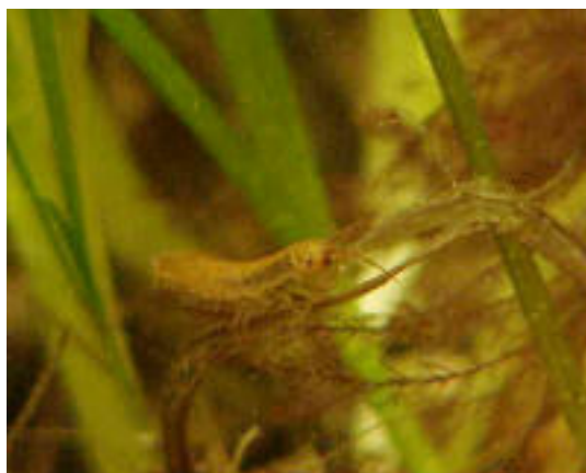
Tånglus - Idothea baltica

Hårnating, Ruppia maritima syns till höger om ålgräset, är en blomväxt cirka 30 cm hög, som ofta bildar täta mattor i form av öar på mycket grunda sandbottnar. Det erbjuder skydd och föda åt ett rikt djurliv av grävande kräddjur, havsborstmaskar och musslor. Här har vi den största biomassan och produktionen av liv per kvadratmeter och år. större än i en tropisk regnskog!