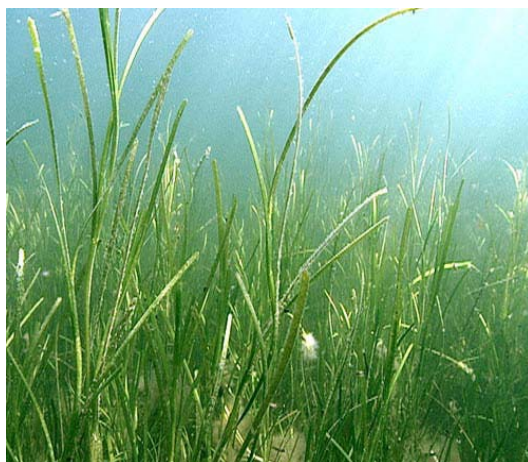
Ålgräsängar - Zosteraängar

Här presenterar vi det marina livet i Öresund i ord och bild. Först kommer en kort presentation av den specifika miljön sedan några djur- och växtarter som man kan hitta där. Sidan kommer fortlöpande att uppdateras.