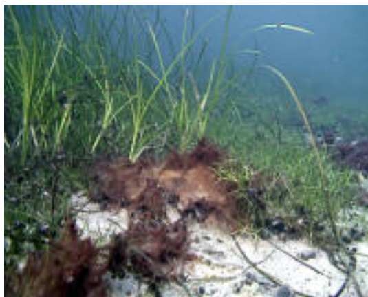
Hårnating - Ruppia maritima

Hårnating, Ruppia maritima syns till höger om ålgräset, är en blomväxt cirka 30 cm hög, som ofta bildar täta mattor i form av öar på mycket grunda sandbottnar. Det erbjuder skydd och föda åt ett rikt djurliv av grävande kräddjur, havsborstmaskar och musslor. Här har vi den största biomassan och produktionen av liv per kvadratmeter och år. större än i en tropisk regnskog!