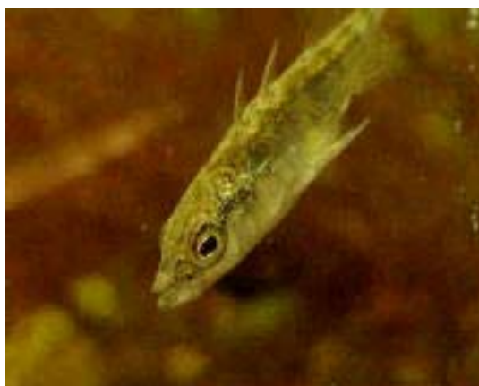
Storspigg (Tretaggad Spigg) - Gasterosteus aculeatus (L)

Kan bli upp till 40 cm långa och väga ca 1 kg. De flesta (2/3) har huvudet högervidet. Skrubban är skrovlig och vass längs sidolinjen och vid basen av rygg- och bukfenorna, liksom på huvud och gällock. Undersidan är ibland delvis pigmentad. På sommaren finns skrubban långt in i Östersjön och i brackvattensområden ända till Ålands Hav. I mars leker den i Öresund på mellan 4-8 meters djup. Skrubban är allätare, men yngre individer äter helst kräftdjur medan de äldre föredrar musslor och småfisk, exempelvis smörbultar.